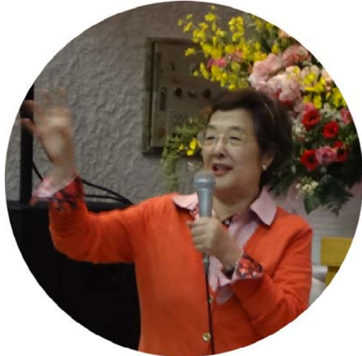
(映画英語アカデミー学会結成大会記念講演にて。平成25年3月16日、相模女子大学)